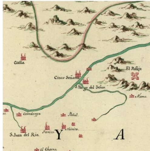
Ruta Monterrey, Saltillo, Parras, Mapimí, Chihuahua y Nuevo México, que corría al norte del Río Nazas, así como los presidios del Pasaje y San Pedro del Gallo que custodian el vado del río aguas abajo de Cinco Señores (Nazas, Durango). Hacienda del Álamo (de los condes). 44