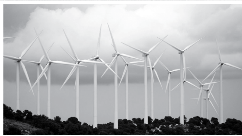
Foto inferior: Central eólica cerca de Higuera, Albacete, España.